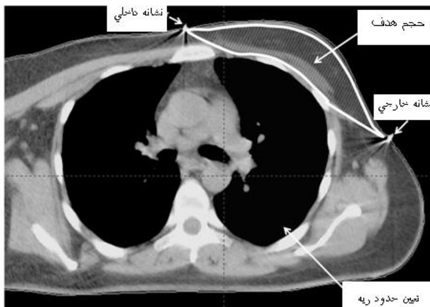
شکل ۱- نمایی از (حجم هدف تحت تابش) PTV و تعیین حدود ریه در طراحی درمان سه بعدی Eclipse 3D TPS

درجه و یا بیشتر بالای سر بیمار و دست دیگر به صورت از لحاظ آناتومی بخش قدامی قفسه سینه از قسمت میانی به سمت گردن دارای یک شیب رو به پایین می باشد [۱]. به منظور موازی کردن شیب قفسه سینه با لبه پشتی پرتو مماسی و از بین بردن شیب، از وجهایی از جنس فوم استفاده شد. در رادیوتراپی پرتو مماسی پستان، کل حجم پستان درگیر، حجم هدف (PTV) ۱ را تشکیل می دهد [۱]. برای ترسیم لبه های میدان مماسی یا محدوده های حجم هدف، حدود فوقانی (خط عبوری از سر استخوان فوق ترقوه) تحتانی (۱ تا ۲ سانتیمتر پایینتر از چین پستان)، جانبی (۱/۵ تا ۲ سانتیمتر خارج شکل ظاهری پستان، در وسط زیر بغل) و میانی (۱ سانتیمتر خارج تر از خط میانی بدن) ترسیم شدند [۱]. برای مشخص شدن این حدود در تصاویر سی تی، قبل از گرفتن تصویر بر روی آنها سیمهای سربی باریک قرار داده شد. بدین ترتیب از کل حجم پستان با برشهایی به فاصله ۰/۵ سانتیمتر از یکدیگر تصویر سی تی تهیه شد. پس از سی تی اسکن، داده های سی تی توسط شبکه کامپیوتری داخلی